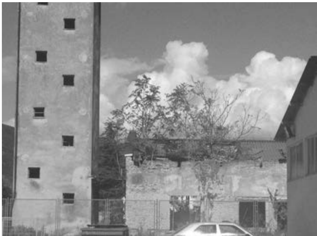
Fabrika “Đuro Salaj” 2370