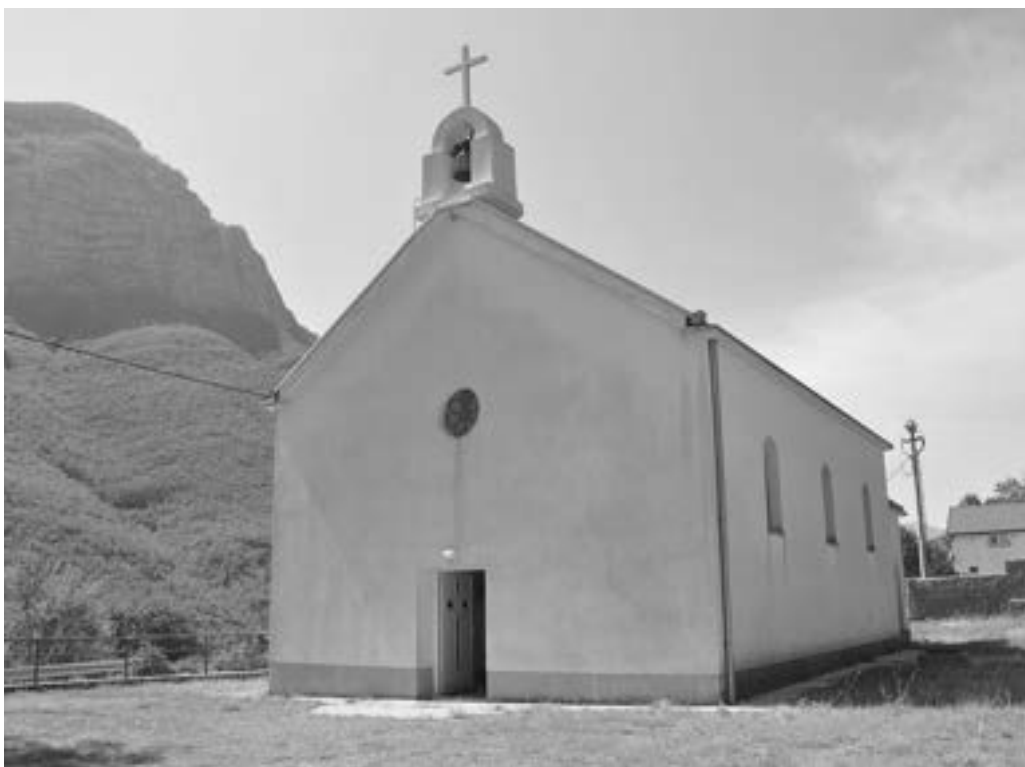
Rimokatolička crkva Svih Svetih 2824