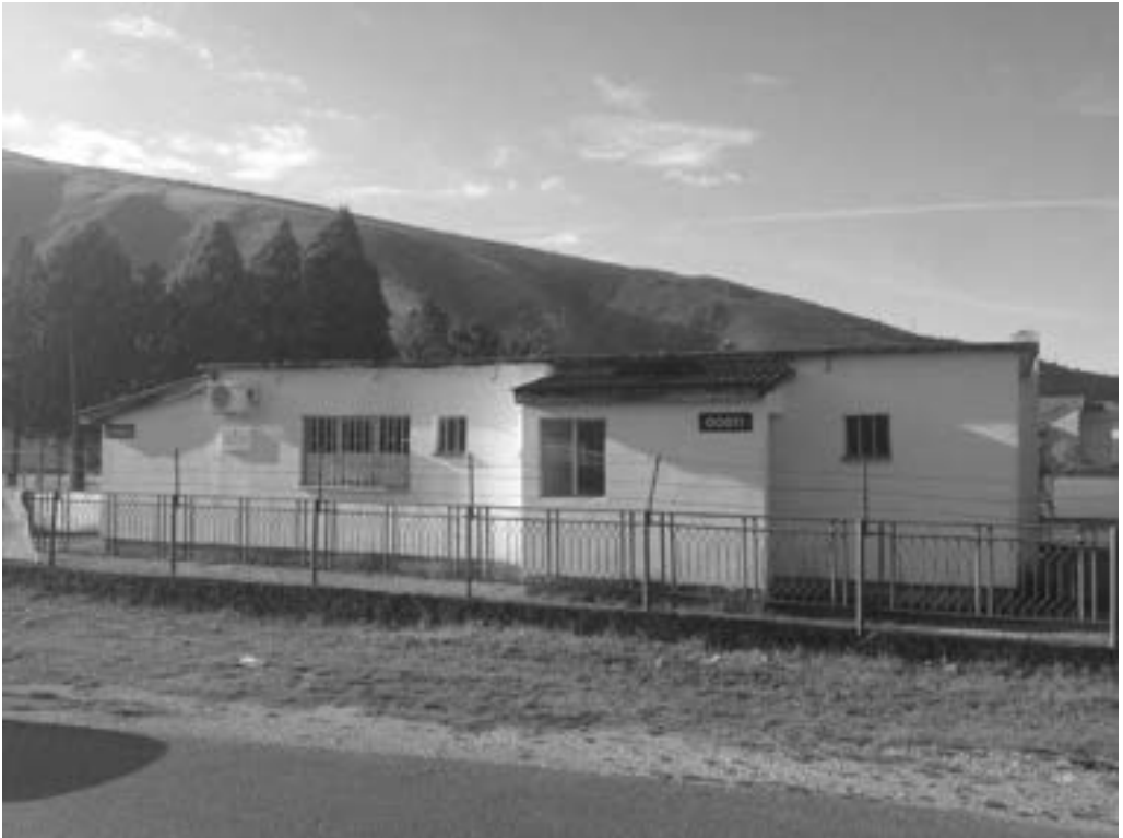
Svlačionica nogometnog stadiona u naselju Vrapčiči 2359