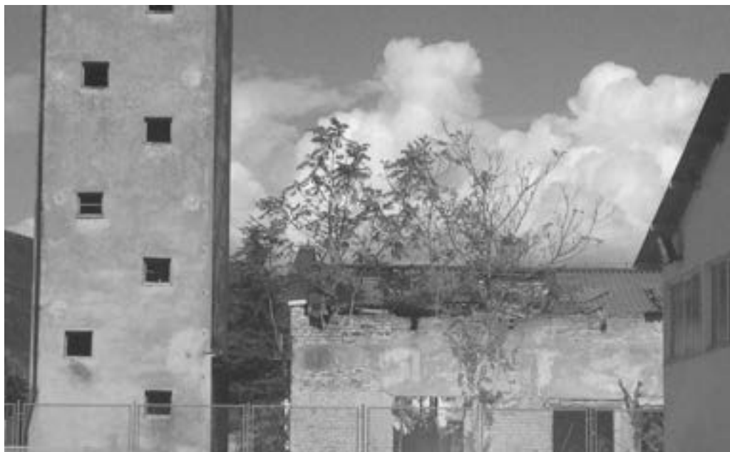
Ostaci fabrike “Đuro Salaj” 2734