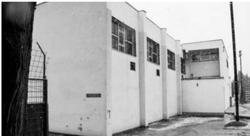
Osnovna škola u Potocima 2660