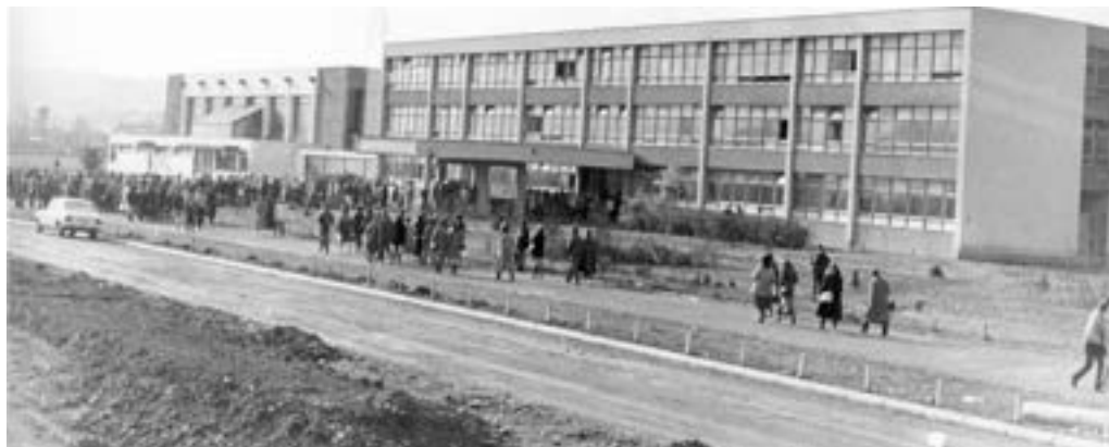
Srednjoškolski centar u naselju Pijeskovi 1276