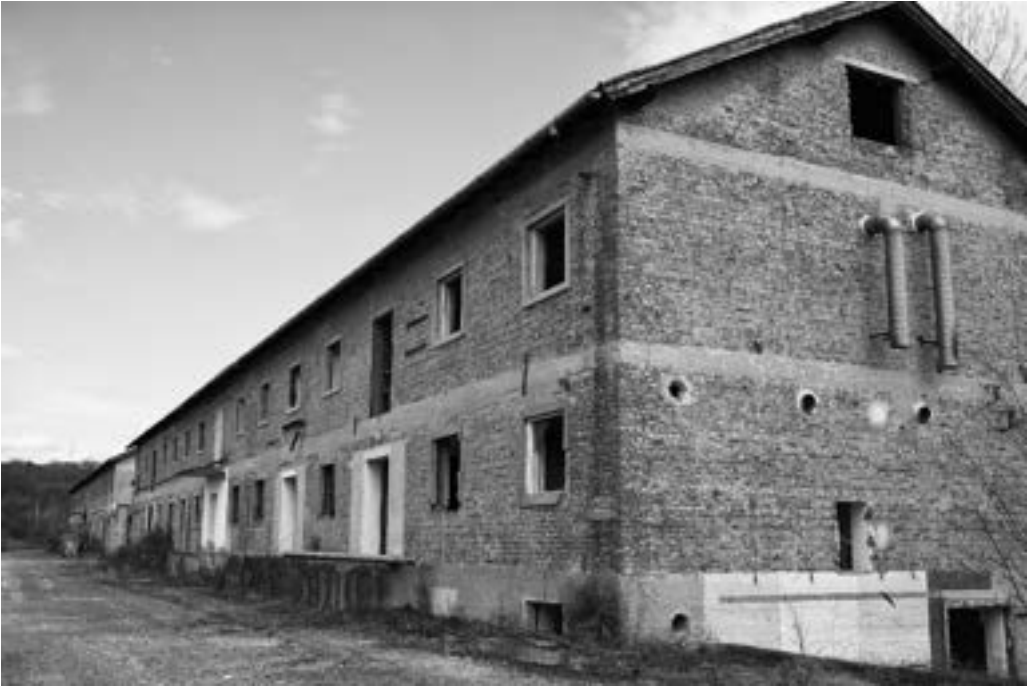
Kasarna JNA u selu Ševarlije 1410