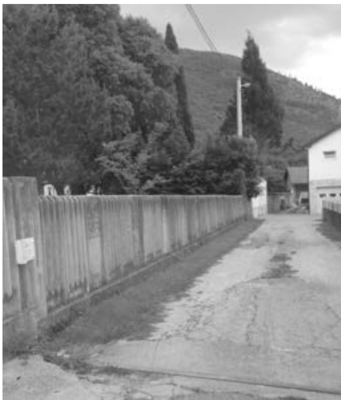
Omerikine kuće 2640