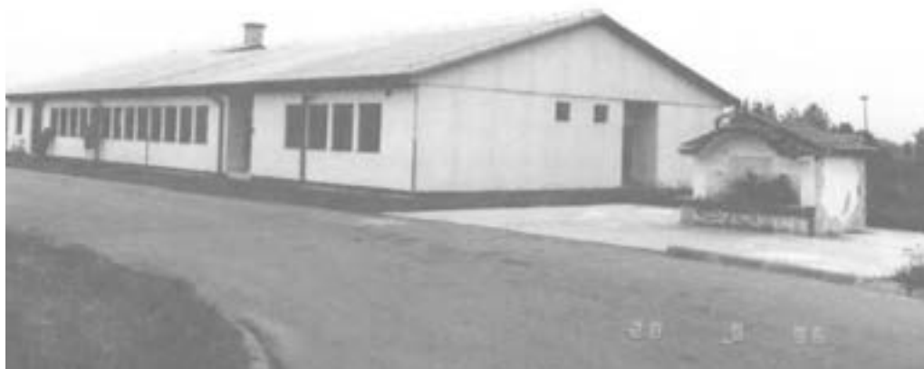
Autobusko preduzeće “Laser” 399