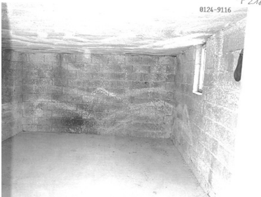
Garaža fabrike “Betonirka” u Sanskom Mostu 3202