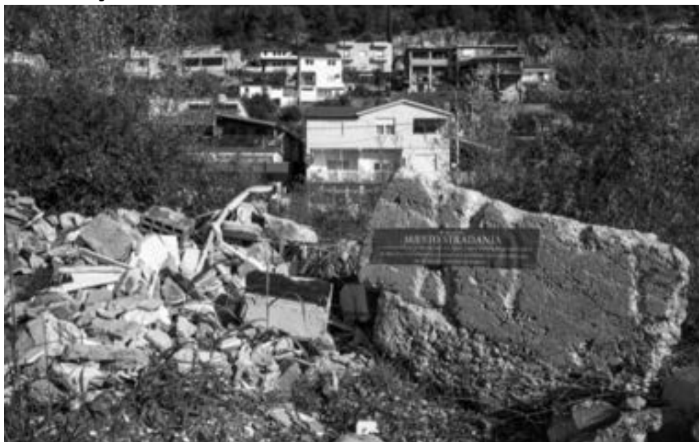
Silos u Čapljini 1151