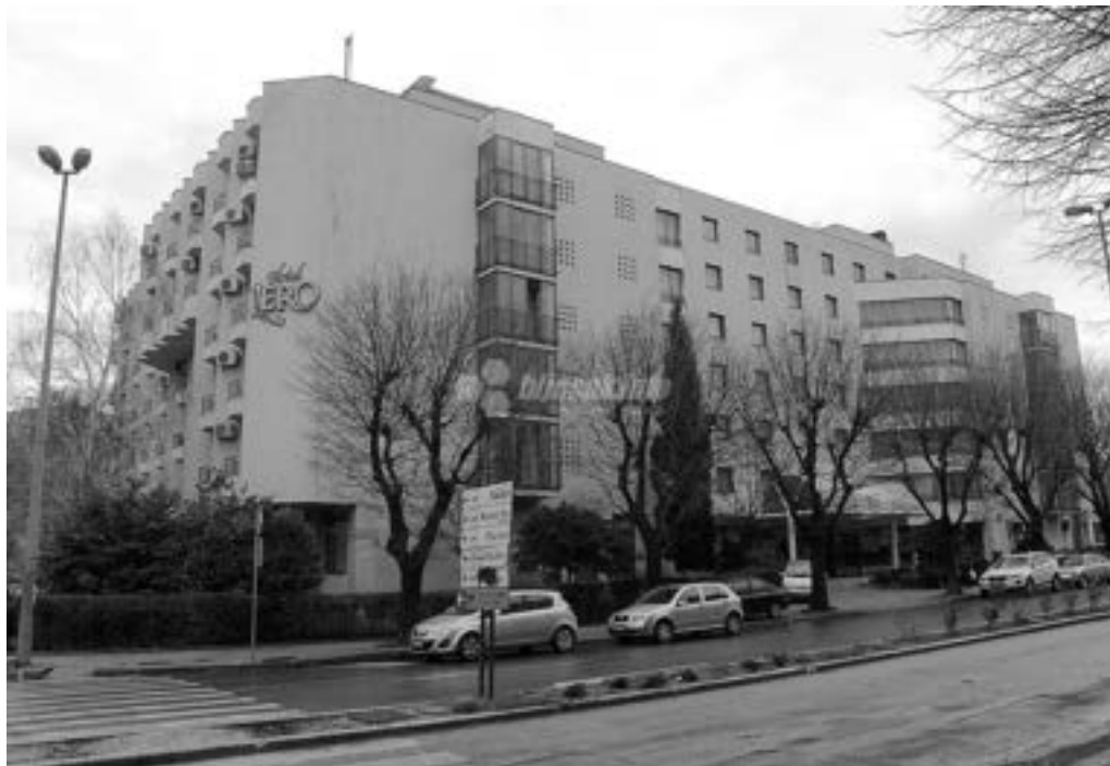
Hotel “Ero” 2775