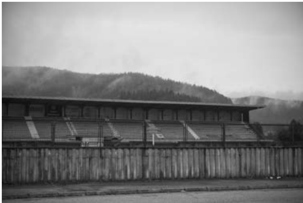
Stadion Mlakve 74