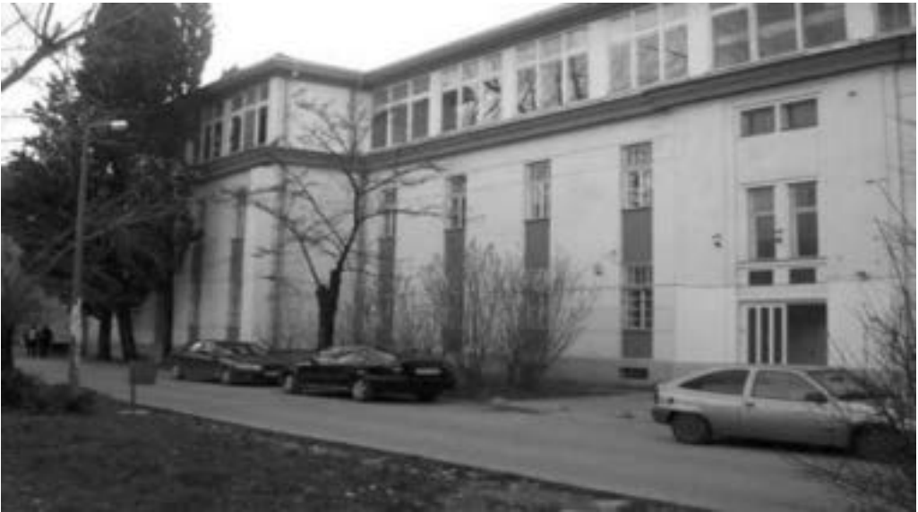
Ekonomski fakultet 2234