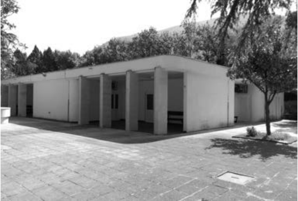
Gradsko groblje Sutina 2343