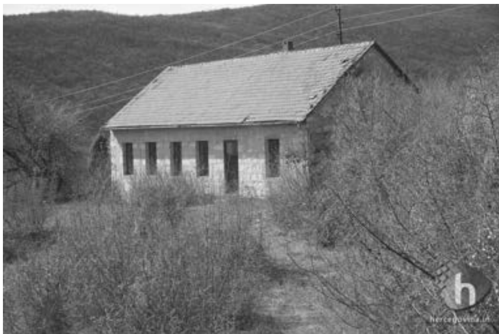
Osnovna škola u selu Đubrani 2555