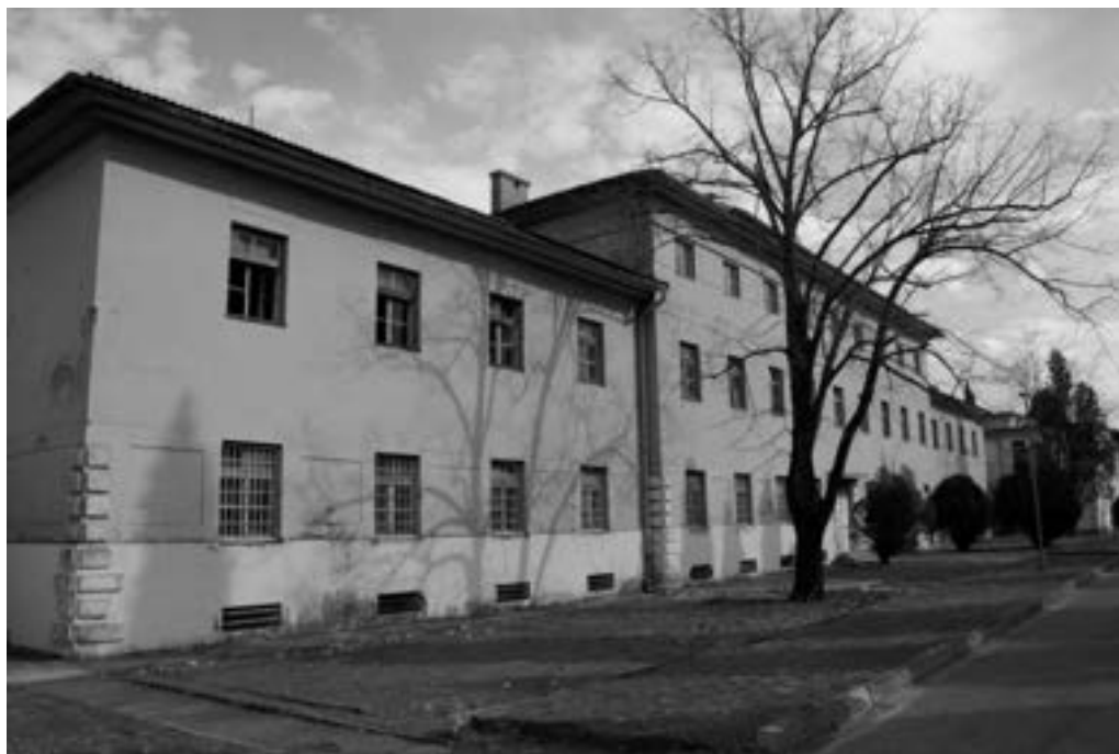
Heliodrom u naselju Rodoč 2420

U junu ili julu 1992. godine HVO je preuzeo kontrolu nad Heliodromom, nekadašnjim kompleksom JNA, i pretvorio ga u svoju kasarnu. 2421