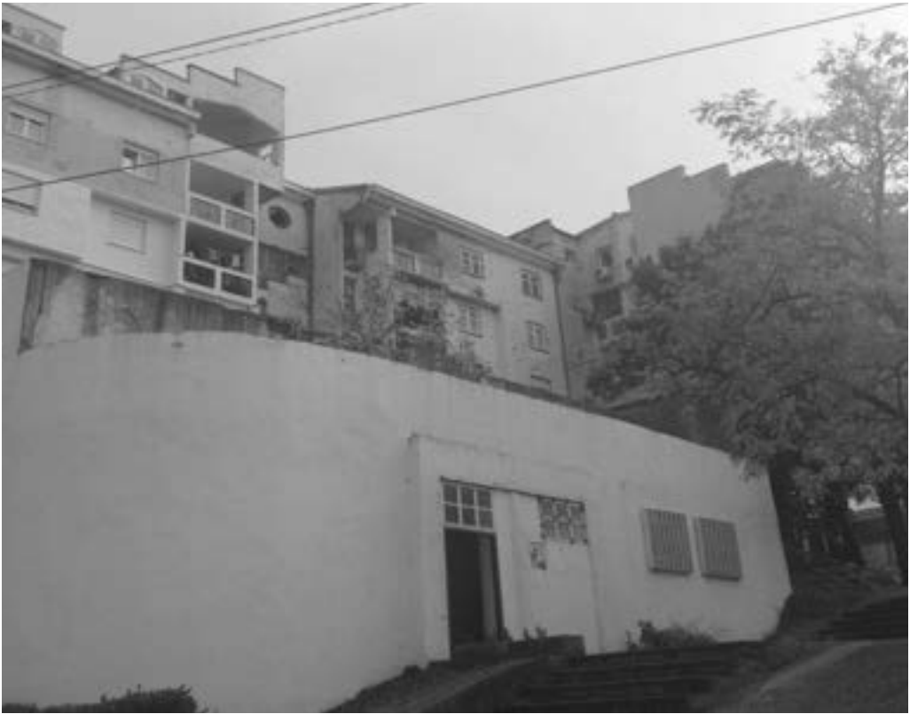
Atomsko sklonište u naselju Zalik 2333