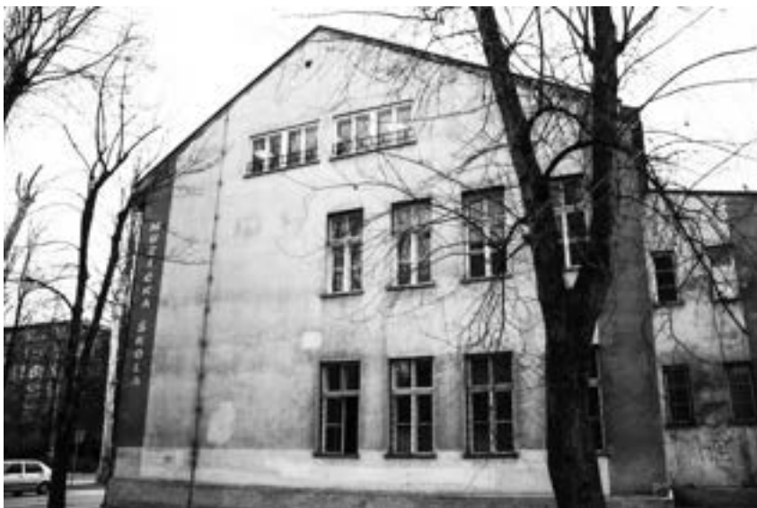
Muzička škola u Zenici 4142