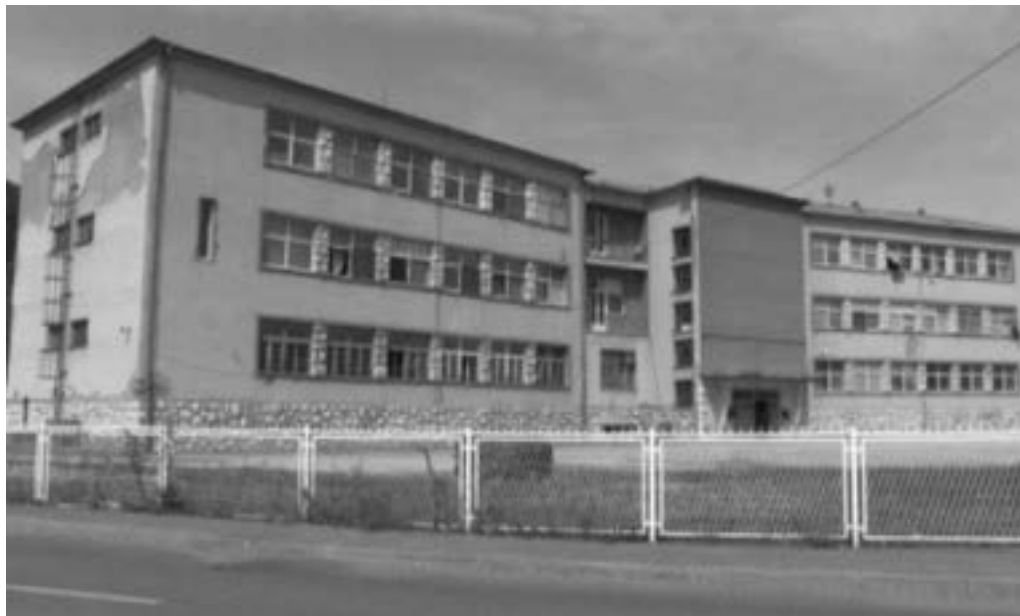
Kasarna JNA “4. juli” u selu Miljkovac 1442