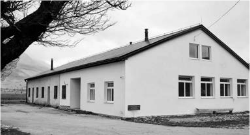
Osnovna škola u selu Zijemlje 2376