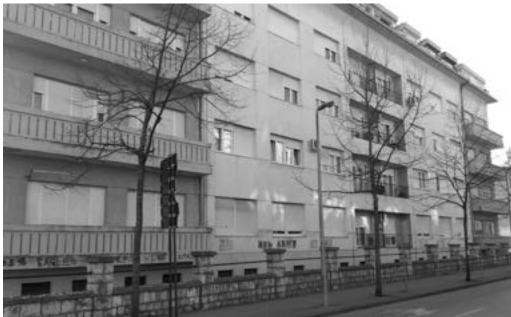
Podrum zgrade u Liska ulici u Mostaru 2764