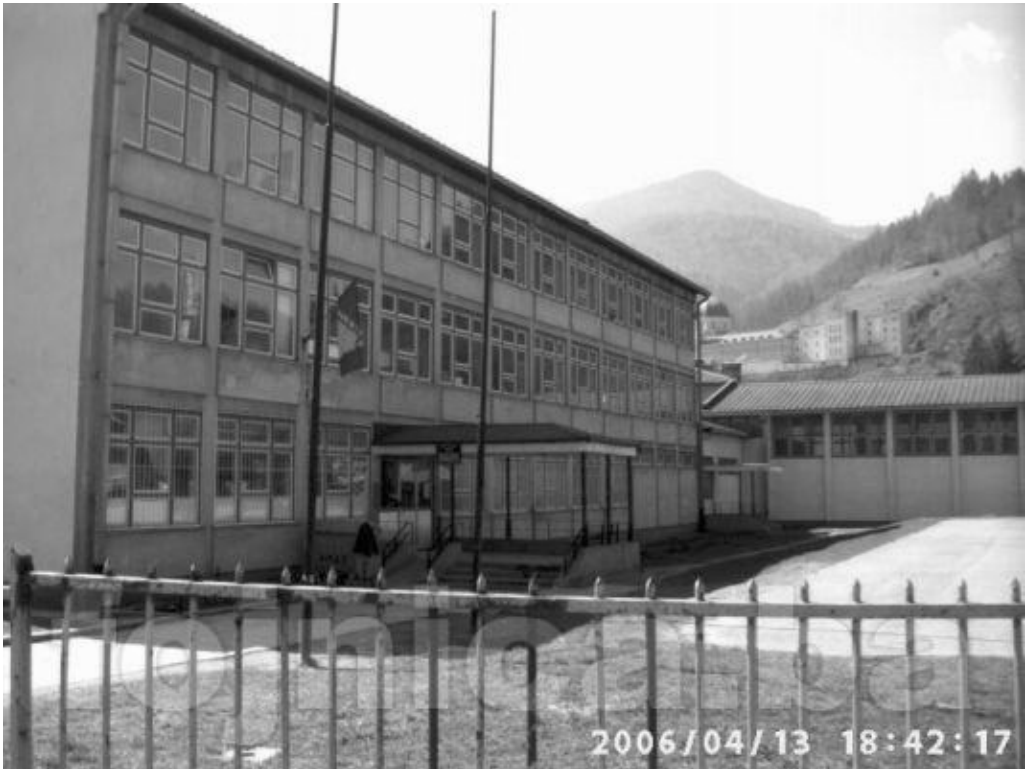
Osnovna škola “Kata Govorušić” u Fojnici 1499