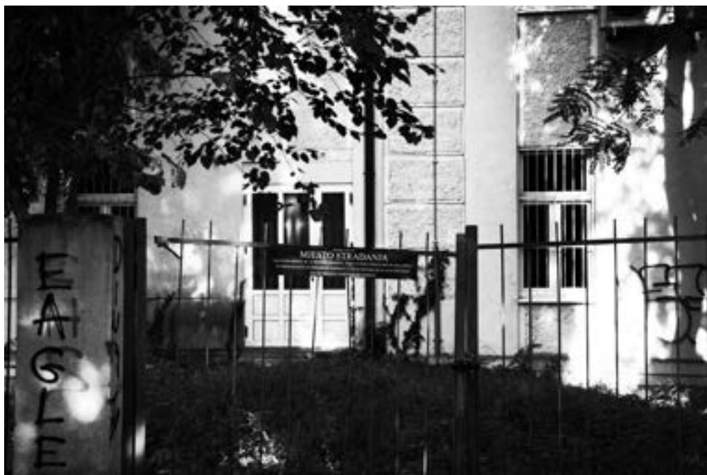
Mašinski fakultet 2522