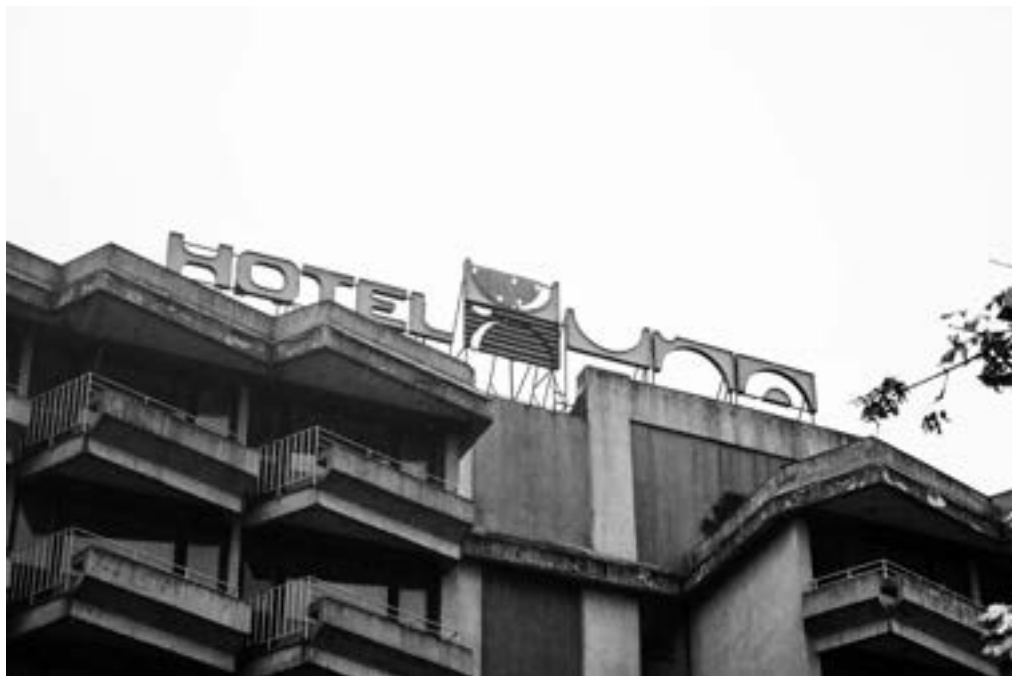
Hotel “Una” 36