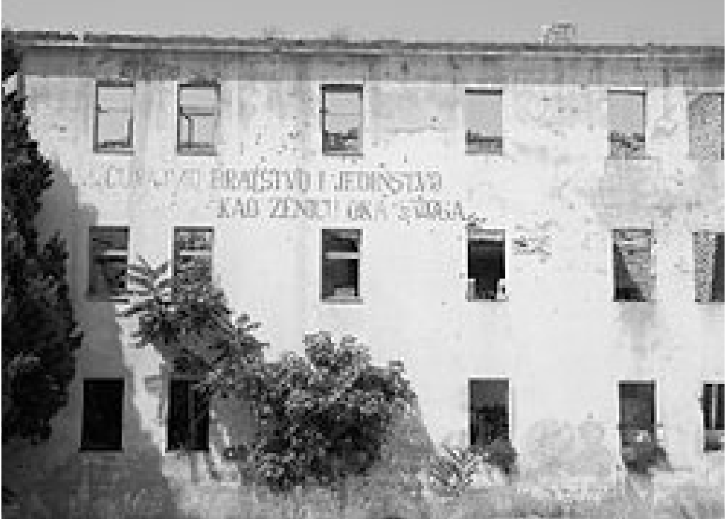
Kasarna Sjeverni logor 2250