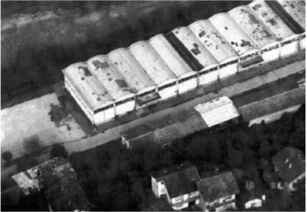
Logor Luka u Brčkom 407