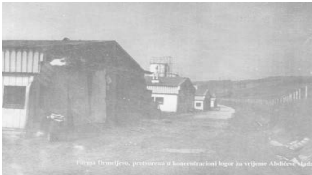
Peradarska farma Drmeljevo 3597