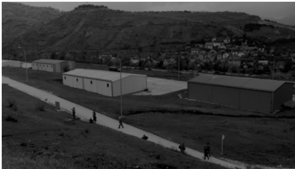
Logor Čelebići 1580