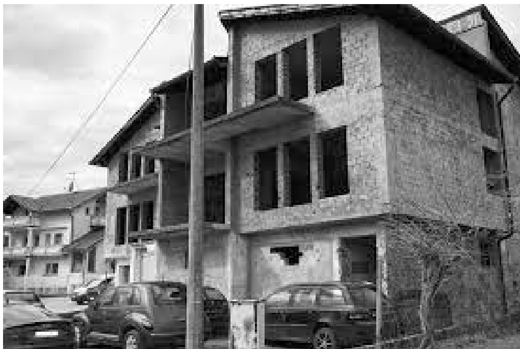
Perčin disko u naselju Vila 1194