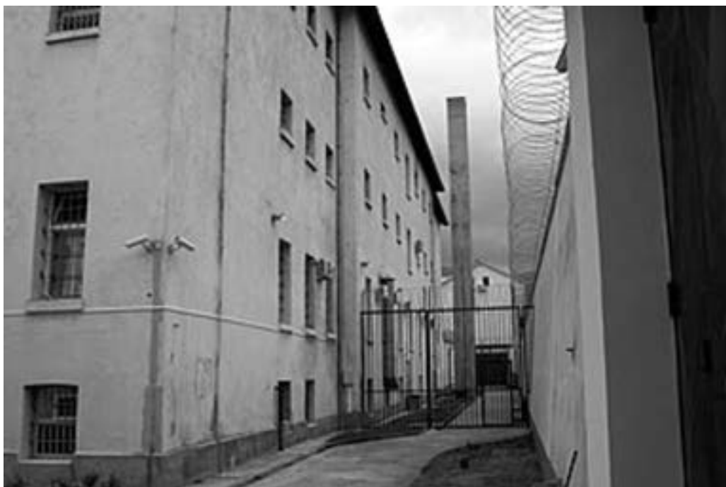
Zatvor Ćelovina 2208

U zatvor Ćelovina, u Šantićevoj ulici, HVO je od aprila do septembra 1992. godine zatvarao Srbe iz Mostara i okolnih sela. Najveći broj zatočenika je u augustu i septembru 1992. prebačen u zatvor Heliodrom u Rodoču.