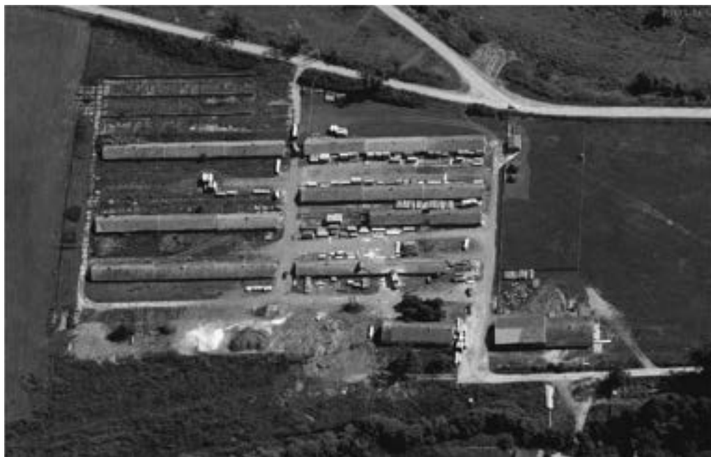
Poljoprivredno dobro Rasadnik 2971