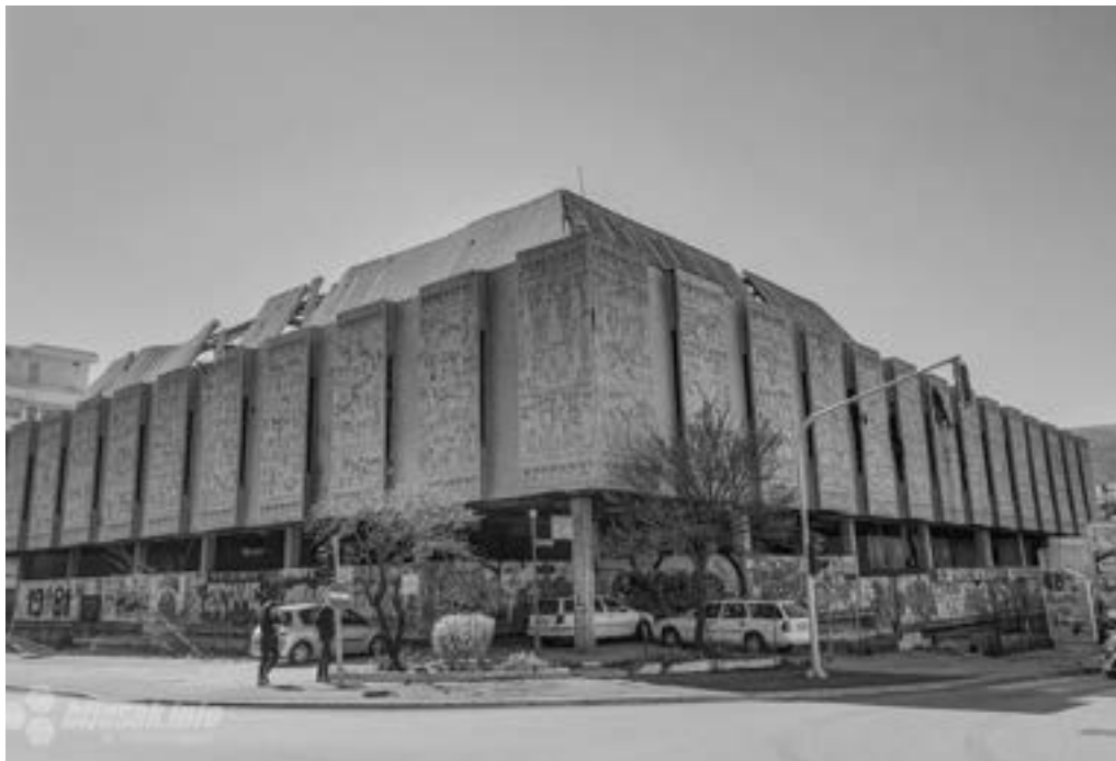
Robna kuća “Razvitak” 2788