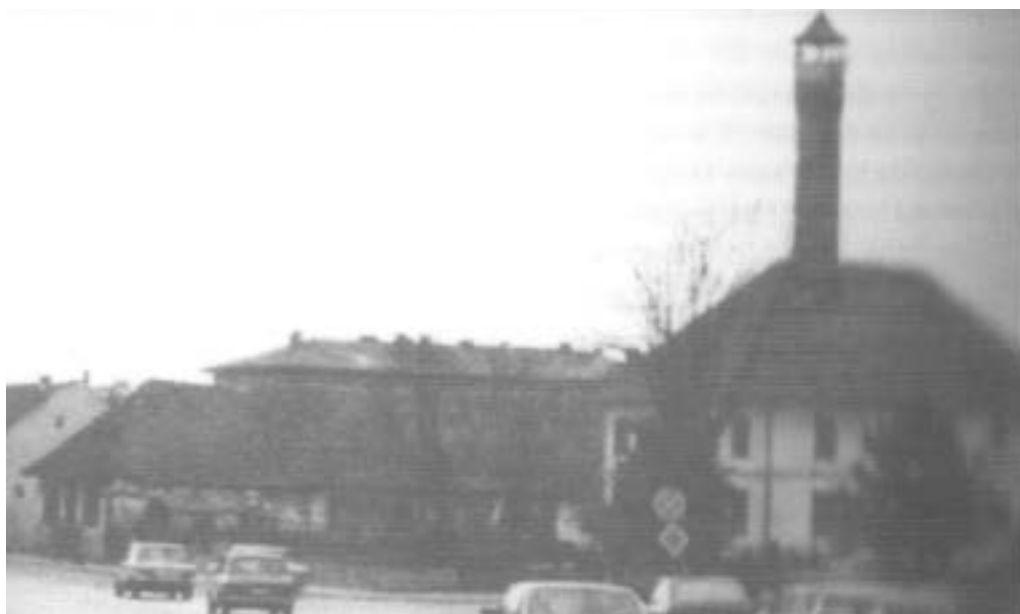
Stara drvena džamija u naselju Kolobara 368