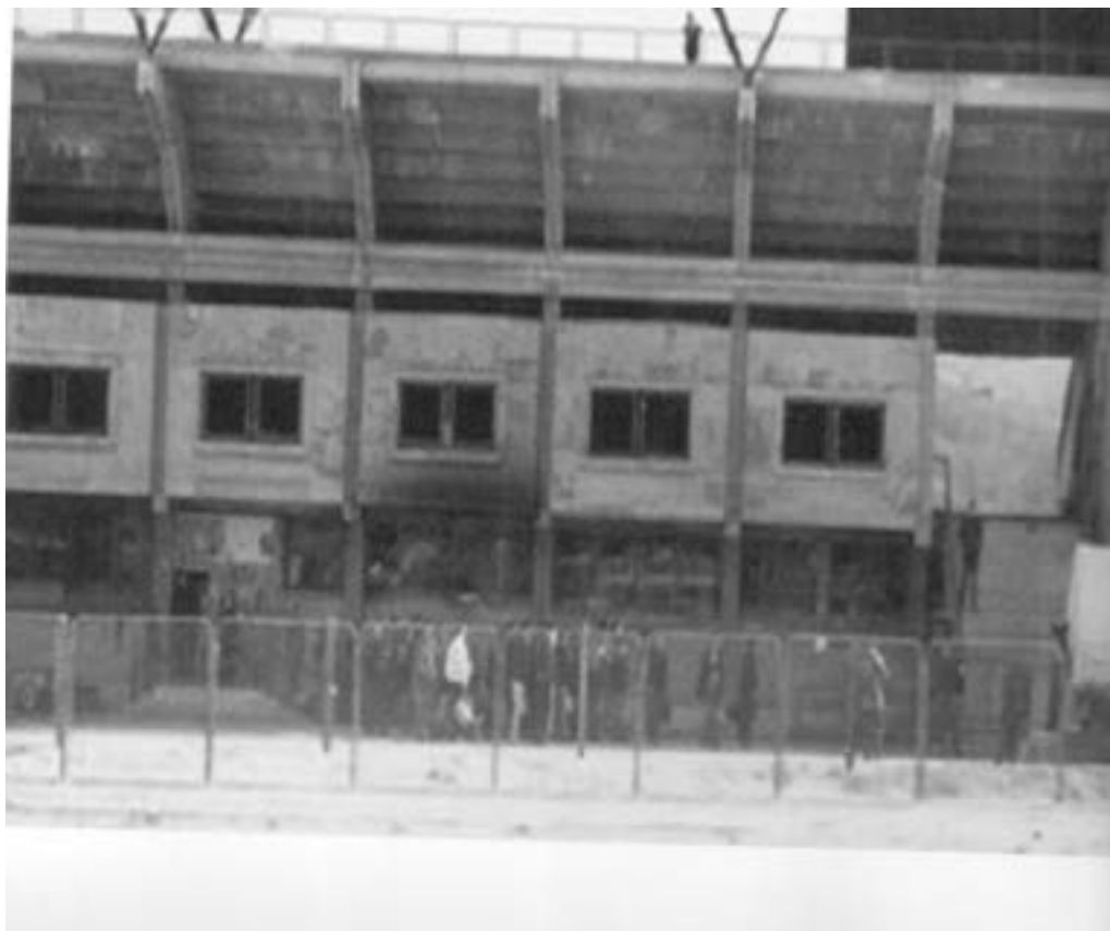
Stadion Nogometnog kluba Iskra 840