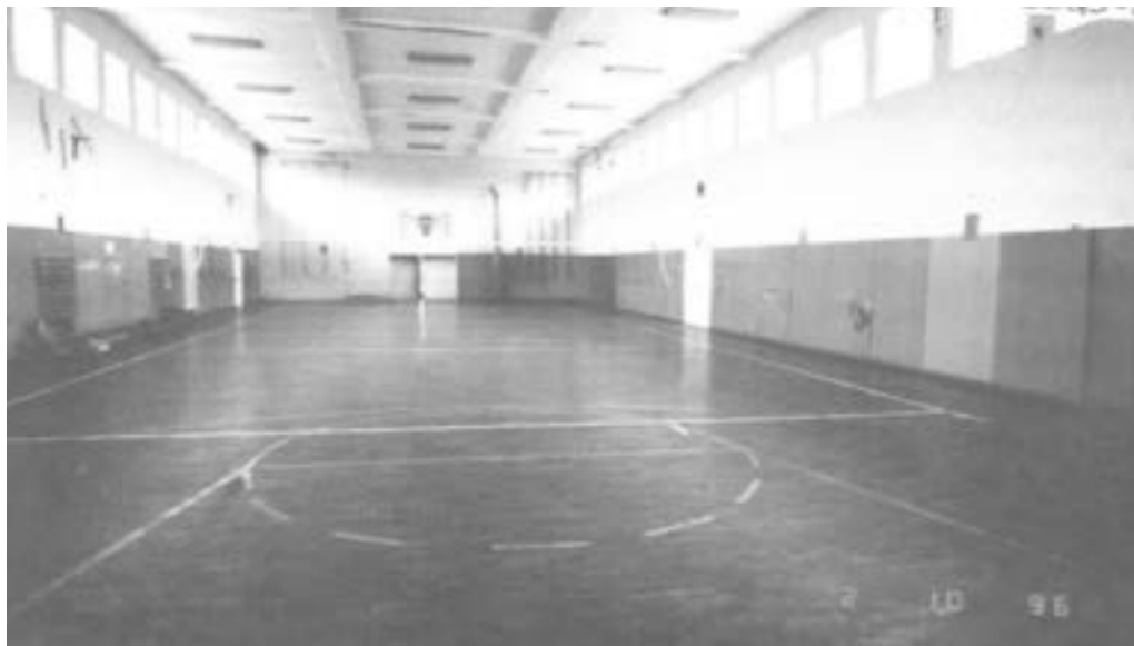
Sportska dvorana “Partizan” 322