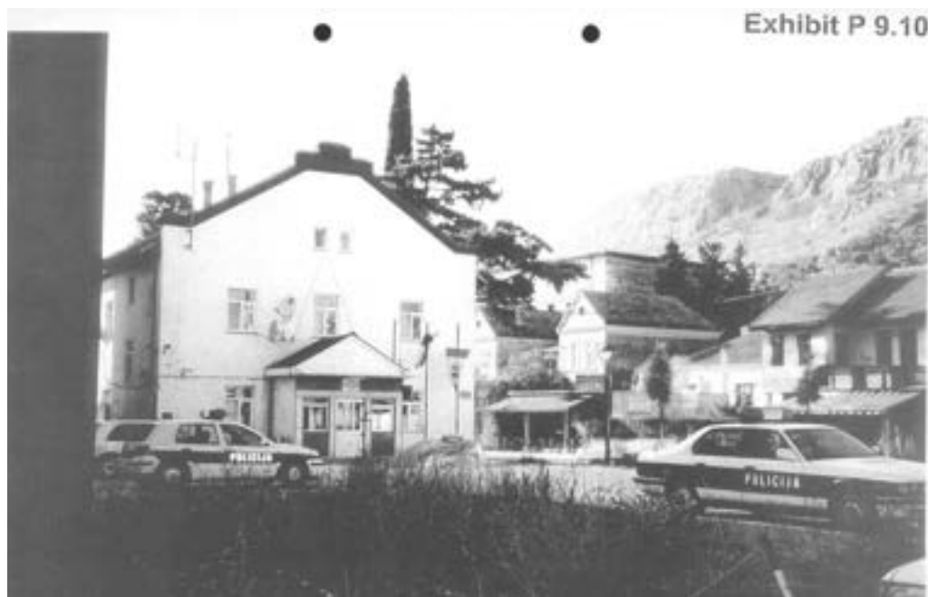
VIZ Ljubuški 2101