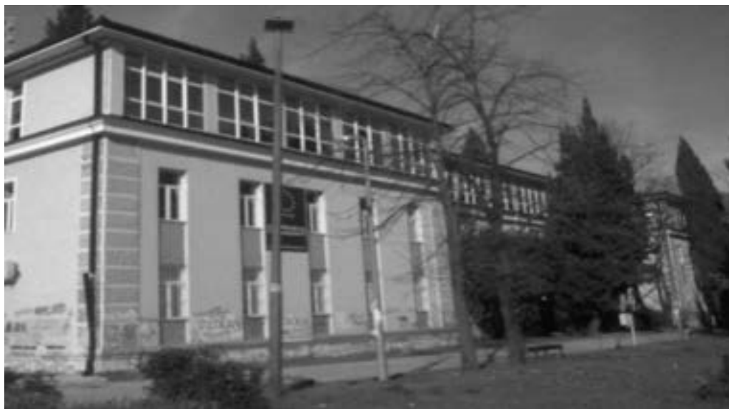
Pravni fakultet 2322