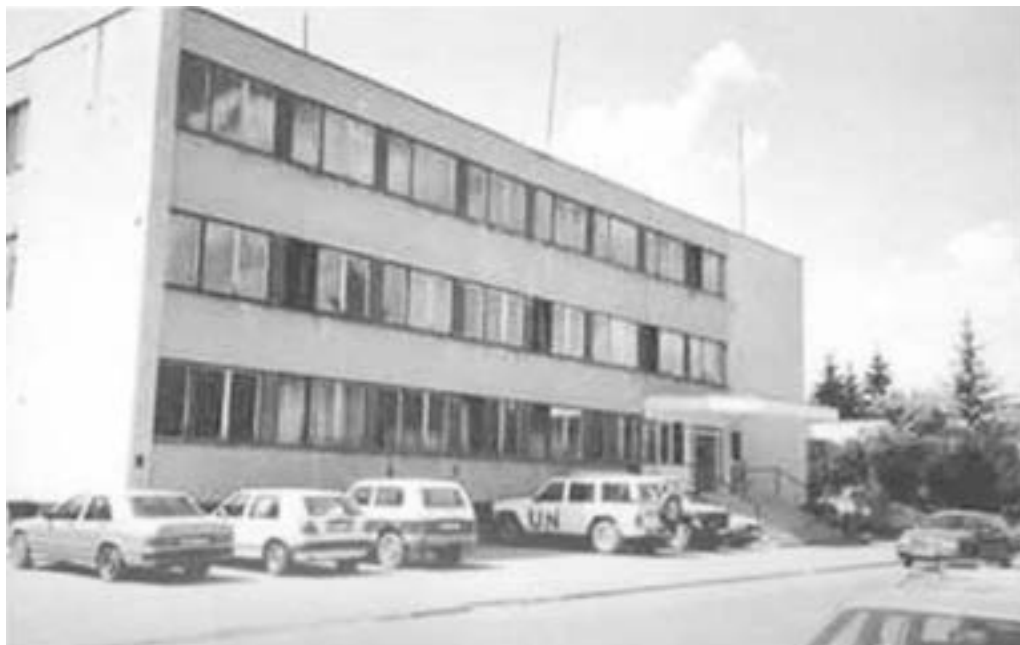
Stanica javne bezbjednosti Bugojno 735