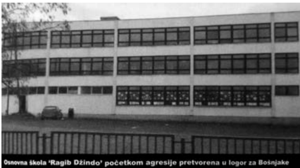
Osnovna škola “Ragib Džindo” u Rogatici 3085