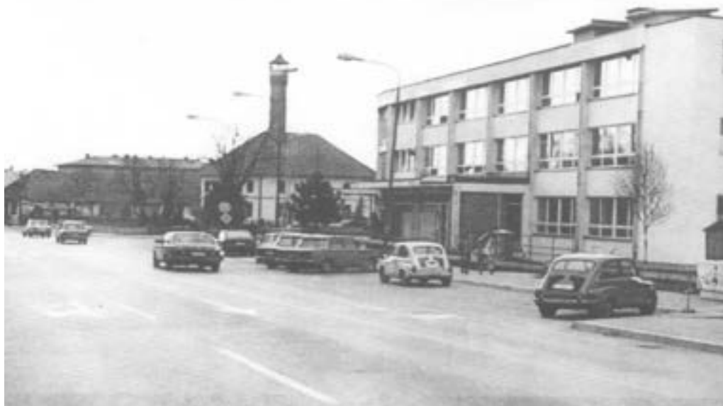
Dom zdravlja 347