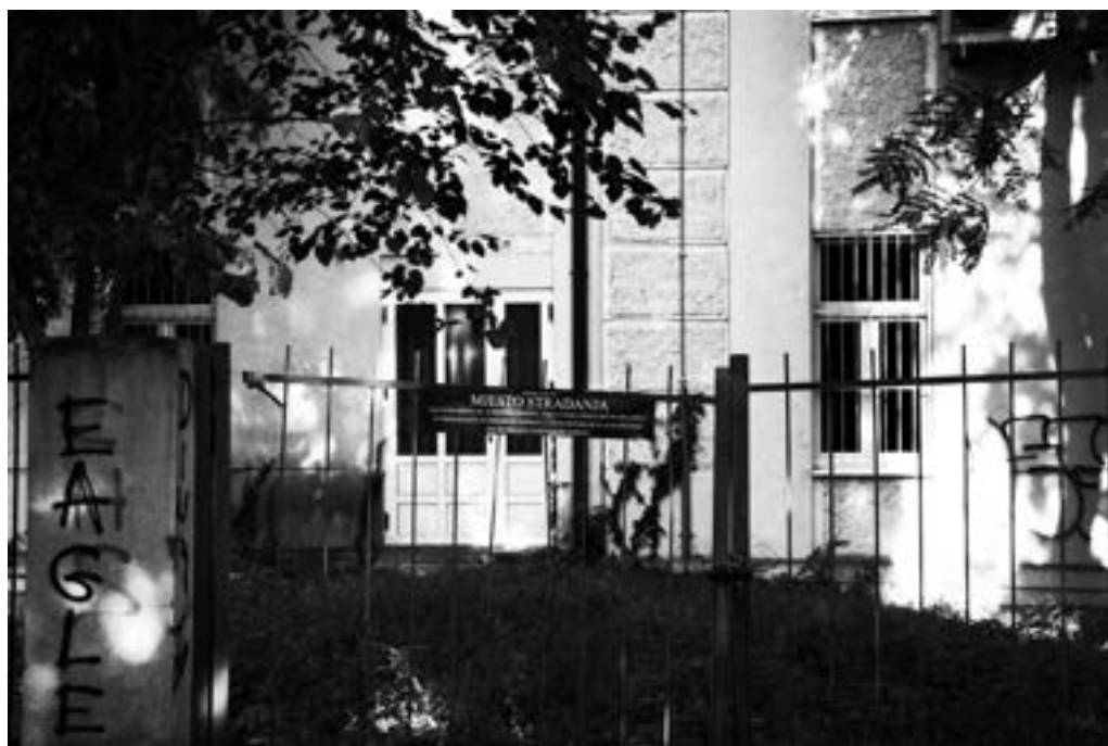
Mašinski fakultet 2308