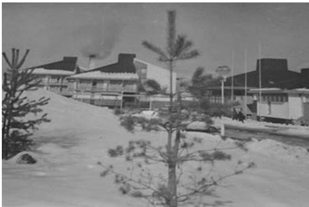
Motel “Akvarijum” 669