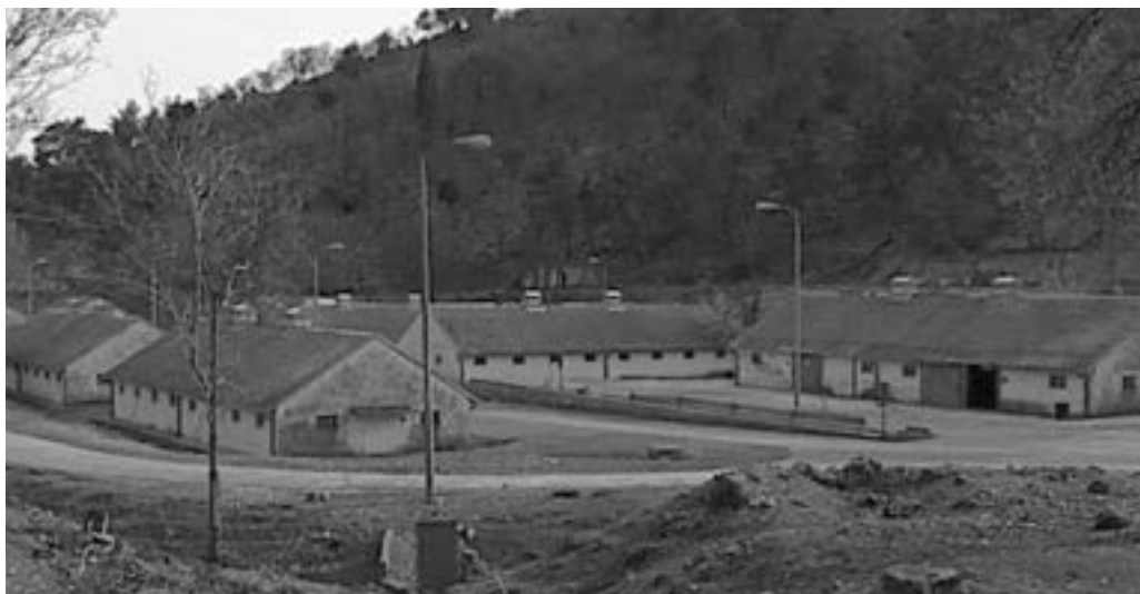
Kasarna “Bruno Bušić” 962